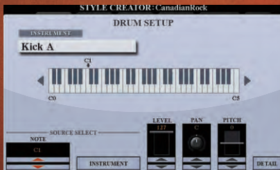
نمایشگر تنظیم درام

در ایجادکننده سبک می توانید پارامترهای مختلفی از کیت درام را با جزئیات دقیق ویرایش کنید، همچنین می توانید "ساز" دلخواهتان را با چیزهای مختلفی از کیت درام ادغام کنید. از نواختن سبک های مختلف با کیت درام بی نظیرتان لذت ببرید!