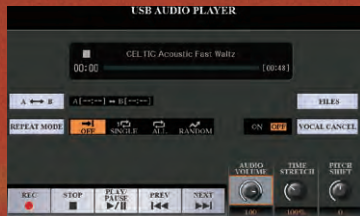
پخش کننده صدای USB