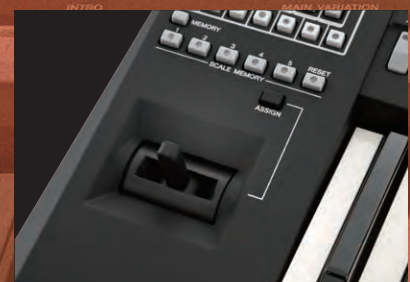
اهرم کنترل با عملکرد قابل تخصیص

دیگری مانند تراک بیضدا و سایر پارامترها را می توانید تخصیص دهید و در کوتاه ترین زمان تغییر دهید. این ویژگی دورنمای دیگری را به عملکرد شما اضافه خواهد کرد. رنگ و بوی بی نظیری به اجرایتان بدهید!